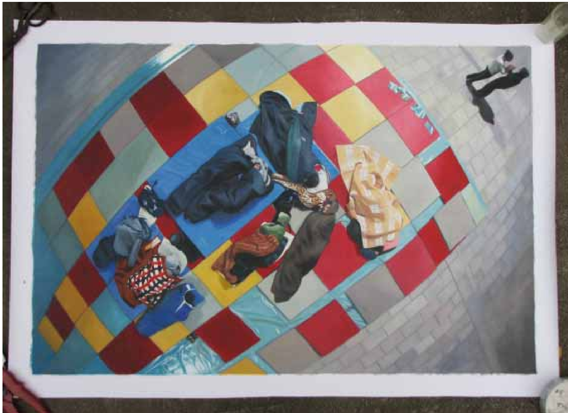
„Кинеска слика“ уље на платну 91x61 cm