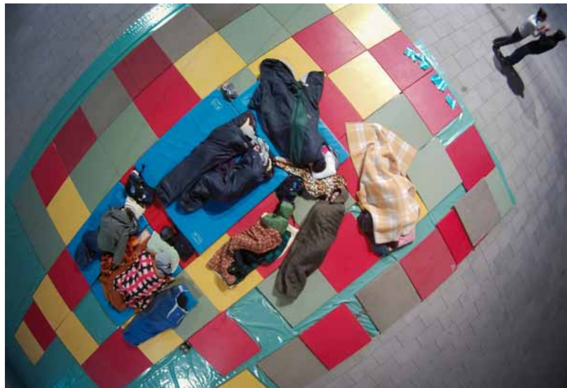
фото - предложак за „Кинеску слику“ (фрејм из видео рада „Велики сан“)

Dakle, mislila sam da cemo se fokusirati manje na sam objekat a vise na rendering. Ti ljudi koji su totalno dehumanizovani prave te predmete I neretko se desavaju greske kulturoloskog tipa npr. Abibas umesto Adidas (jer ne poznaju fonetsko pismo pa im je teze da uoce tu vrstu razlike). Upravo ta odstupanja podsecaju da se radi o ljudima koji imaju